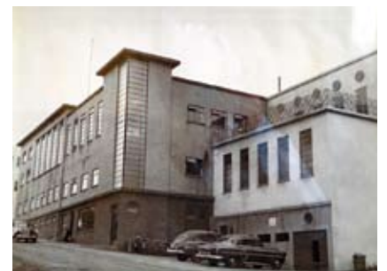
Mjólkursamlag KEA í Grófargili 1939-1980