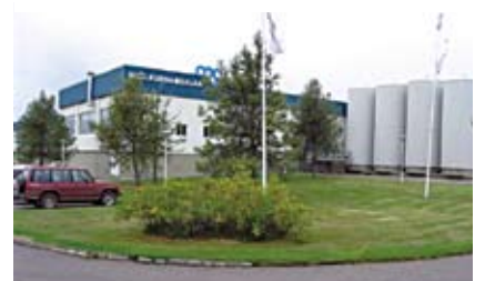
MS Akureyri 2007