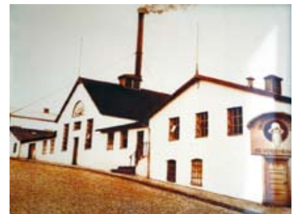
Mjólkursamlag KEA í Grófargili 1928-1939